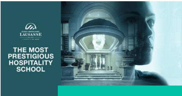
Ecole hôtelière Lausanne – Bannière LinkedIn Média