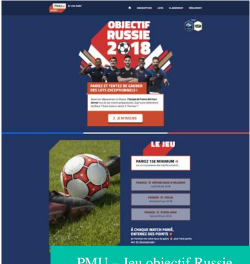
PMU – Jeu objectif Russie 2018