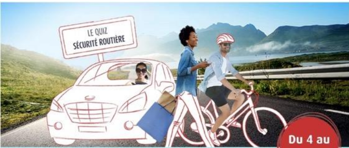
MACSF – Sécurité routière, Pub Facebook