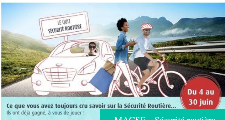
MACSF – Sécurité routière, Pub Facebook