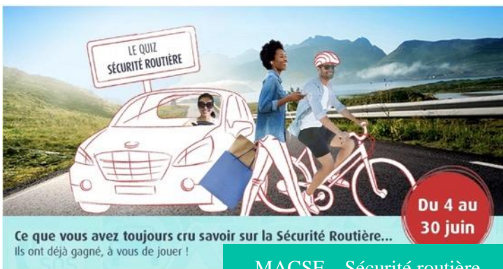
MACSF – Sécurité routière, Pub Facebook