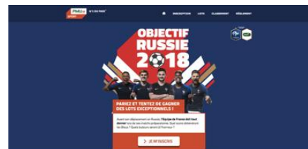
PMU – Jeu objectif Russie 2018